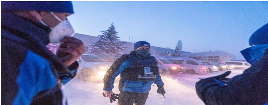
Спостерігачі СММ у Северодонецьку Луганської області