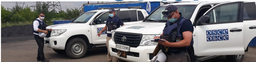
Наблюдатели возле участка разведения в районе Золотого, Луганская область

Специальная мониторинговая миссия ОБСЕ в Украине (СММ) osce.org/ru/ukraine-smm