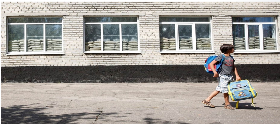
Школярка біля школи, розташованої поблизу лінії зіткнення (Донецька область)