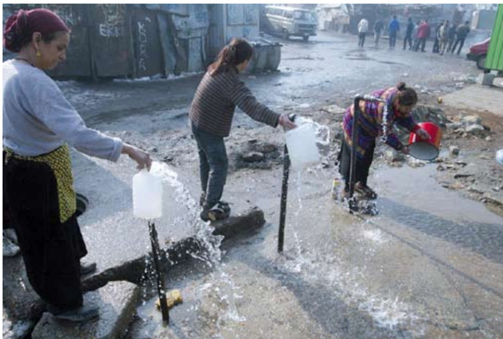
Женщины набирают воду в поселении рома Депония в Белграде.