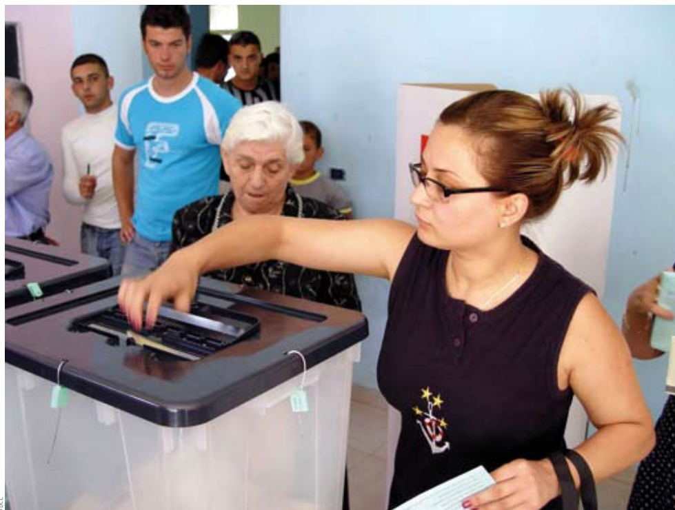
Избиратель опускает свой бюллетень на парламентских выборах в Албании 3 июля.

Начиная с 2001 года БДИПЧ поддерживает усилия по наращиванию потенциала и обмену информацией с группами непартийных внутренних наблюдателей за выборами, признавая тем самым их роль в обеспече-