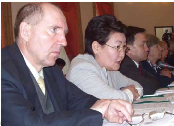
Участники форума в Астане обсуждают казахстанский законопроект о национальной безопасности, 22 апреля. Николай Белоруков, член Конституционного суда Казахстана, слева.

Написание качественного закона — только половина дела. Опыт показывает, что наиболее эффективные и действенные законы являются результатом законотворческого процесса, состоящего из нескольких эта-