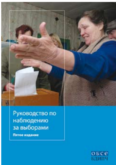
Уже изданное на английском, французском, русском, сербском и украинском языках, данное руководство будет переведено на несколько других языков в 2006 году.