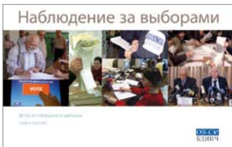
Полный и в то же время компактный обзор методики БДИПЧ по наблюдению за выборами проведен в опубликованной в декабре брошюре под названием «Наблюдение за выборами – Десять лет наблюдения за выборами: люди и практика».

В 2002 году БДИПЧ начало направлять миссии по оценке выборов в страны с давно установившимися демократическими режимами или страны, завершившие переход к демократии. Подобные миссии состоят из группы специалистов, которые посещают страну непосредственно накануне и в день голосования, для того, чтобы провести общую оценку организации выборов и законодательной базы для их проведения и предоставить адресные рекомендации. Миссия по оценке выборов не готовит комплексных замечаний по поводу избирательного процесса, как это делает миссия по наблюдению