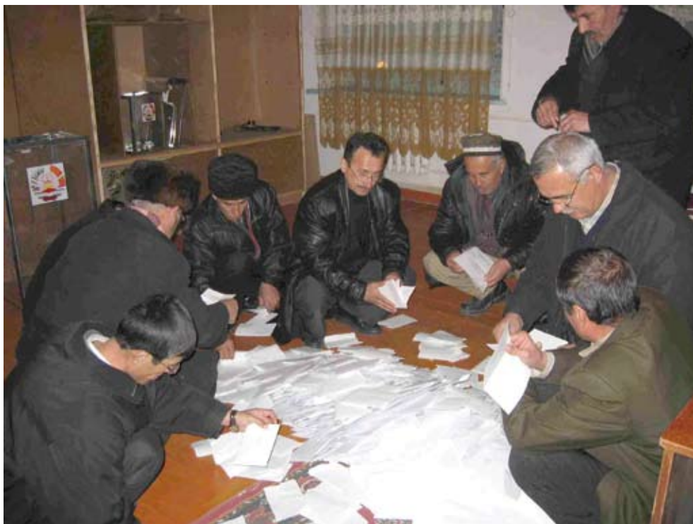
Представители избирательной комиссии подсчитывают голоса на избирательном участке в городе Куляб на юге Таджикистана в ходе парламентских выборов 27 февраля.

для работы над этой проблемой экспертное совещание по обсуждению соответствующих вопросов, касающихся автоматического или электронного голосования и голосования через интернет, в целях дальнейшей разработки методики наблюдения за использованием этих новых технологий. В ответ на эти рекомендации в 2006 году БДИПЧ осуществит проект, целью которого будет разработка руководящих принципов наблюдения за электронным голосованием.