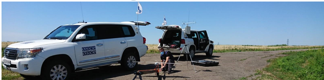
Спостерігач СММ здійснює запуск БПЛА біля Федорівки Донецької області