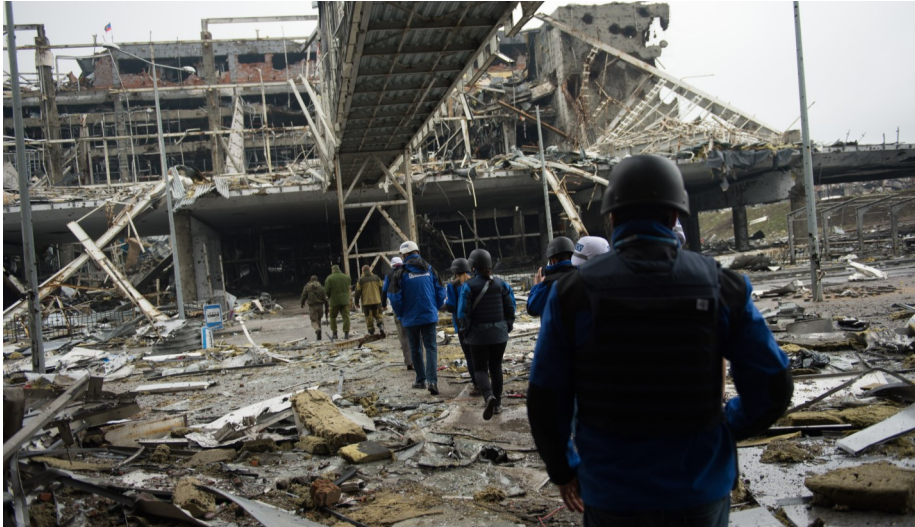
Заступник Голови СММ Александер Хуг відвідав Донецький аеропорт 2 квітня 2015 р.