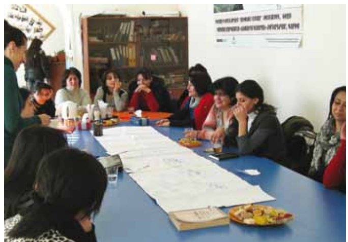
Une équipe d'évaluation faisant partie du Bureau du contrôle interne détermine par quels moyens l'OSCE a contribué à améliorer les conditions de vie des membres d'un centre de ressources pour femmes en Arménie qui bénéficie du soutien du Bureau de l'OSCE à Erevan, novembre 2011.