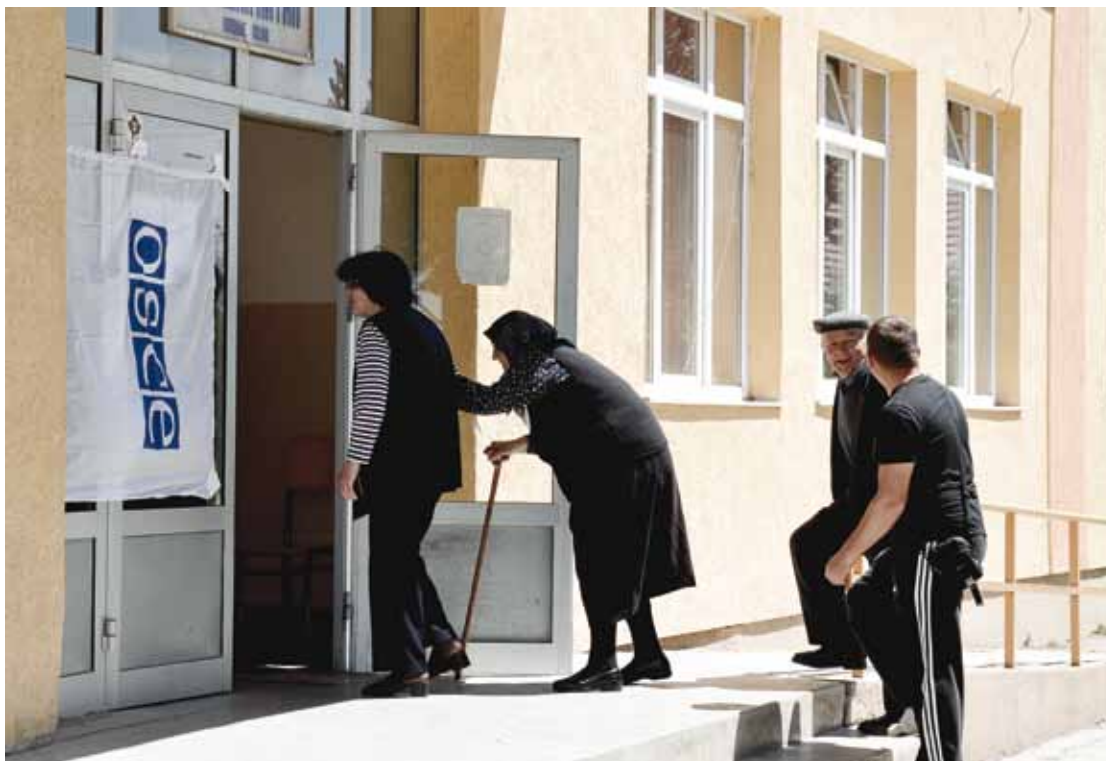
Des électeurs du village de Laplje Selo, une enclave de Serbes de souche dans la municipalité de Gracanica/Gračanić, à proximité de Prishtinë/Priština, entrent dans un bureau de vote mis en place par l'OSCE pour y voter lors du premier tour des élections présidentielles et législatives serbes, le 6 mai 2012.