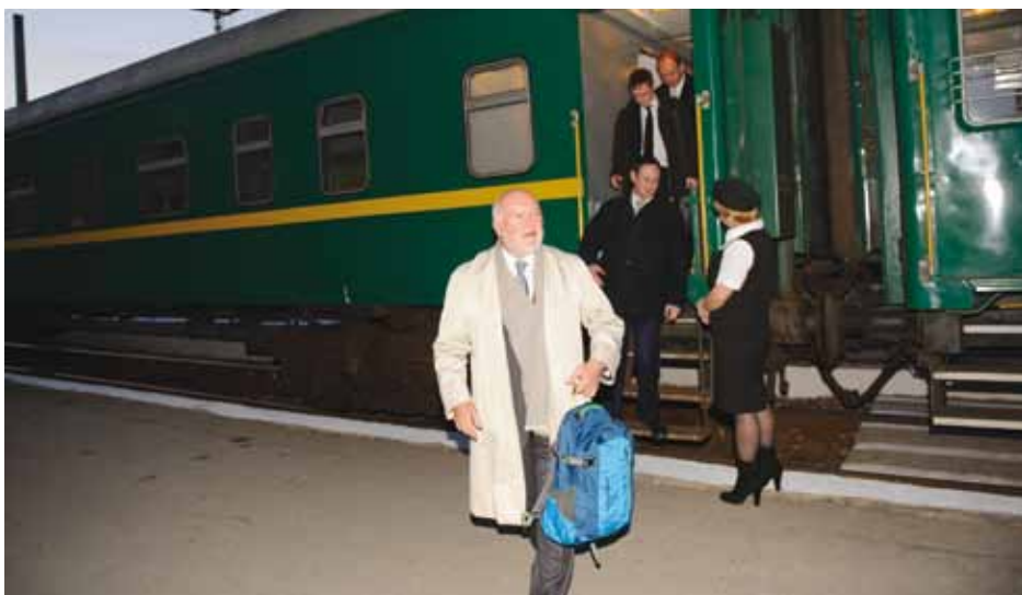
L'Ambassadeur Erwan Fouéré, Représentant spécial du Président en exercice pour le processus de règlement transnistrien, descend du train à la gare de Tiraspol, le 3 avril 2012.

Nous avons bon espoir, avec le niveau actuel de volonté politique, d'être en mesure d'accomplir des progrès substantiels, du fait du souhait on ne peut plus manifeste des deux parties, qui était patent à Dublin comme à Vienne, d'avancer le plus possible.