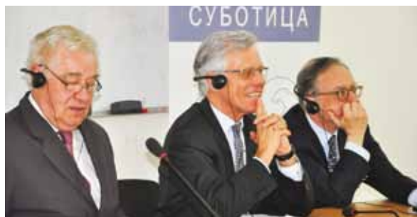
Cette page et page 24: le Haut Commissaire pour les minorités nationales Knut Vollebaek (au centre dans la photo en bas à droite) s'entretient avec des étudiants du département universitaire multilingue à Bujanovac (Serbie), mars 2012.

compte des sensibilités culturelles et politiques locales.