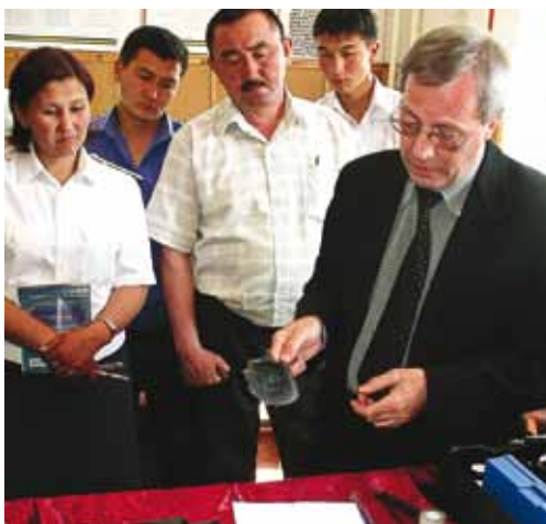
Formation de la police à Bichkek. Le Bureau du contrôle interne a évalué les activités de formation de la police menées par l'OSCE au Kirghizstan ainsi qu'en Serbie et dans l'ex-République yougoslave de Macédoine en 2009 et 2010.