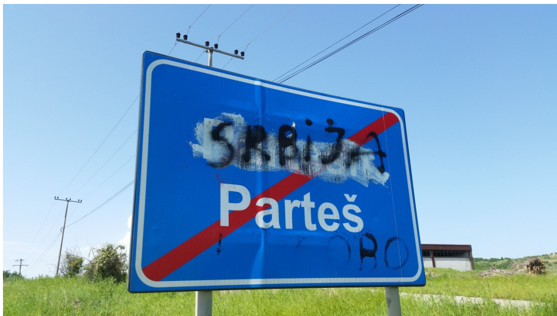
Shenjë rrugore në komunën e Parteš/Parteshit, 28 maj 2014

Derisa detyrimi për të siguruar përkthim me gojë gjatë mbledhjeve të kuvendit komunal respektohet në masë të madhe, ende ka shqetësime përkitazi me faktin që më se gjysma e komunave nuk i përkthejnë procesverbalet e mbledhjeve. Gjithashtu, gjysma e komunave nuk e respektojnë detyrimin për t'i nxjerrë gjithë projektaktet dhe legjislacionin komunal në të gjitha gjuhët zyrtare, dhe as atë për të siguruar që këto përkthime të kenë cilësi adekuate. Komunat duhet t'i shtojnë burimet njerëzore dhe financiare për të siguruar përkthim me gojë gjatë mbledhjeve publike dhe përkthimin adekuat me shkrim të të gjitha dokumenteve zyrtare.