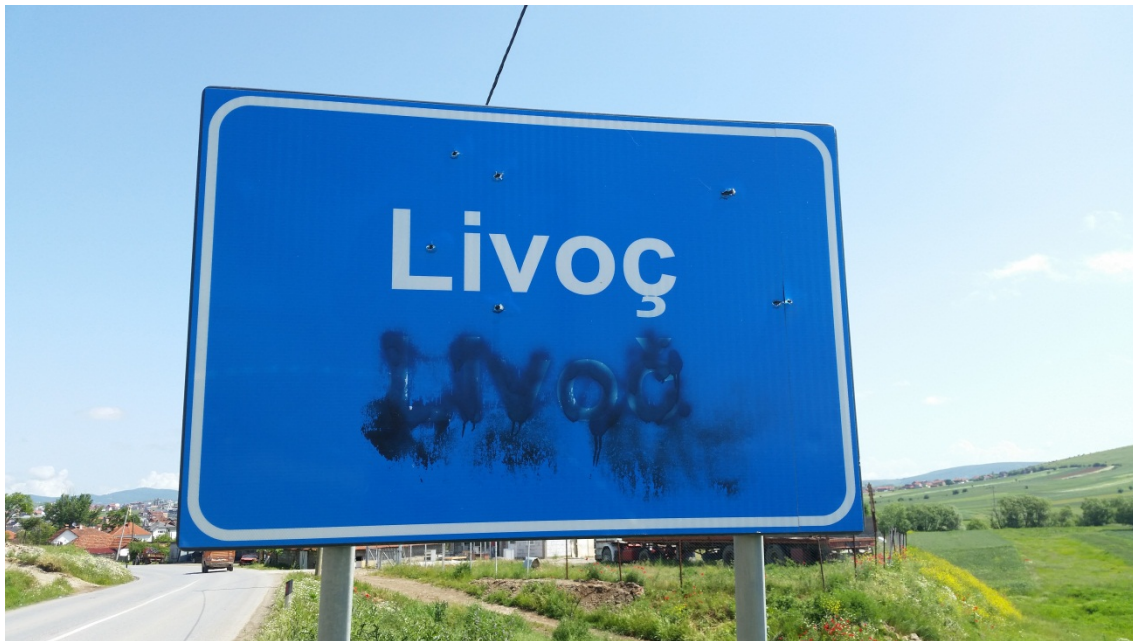
Shenjë rrugore në komunën e Gjilanit/Gnjilane, 28 maj 2014

Komunat mbeten të paafta për zbatimin e plotë të Ligjit për përdorimin e gjuhëve për shkak të faktit që ato ende kanë numër të vogël të personelit për ofrimin e shërbimeve të përkthimit me gojë dhe me shkrim. Numri i pamjaftueshëm i përkthyesve, kualifikimet joadekuate dhe kushtet joadekuate të punës shpesh shpijnë në përkthime të cilësisë së ulët. Njësitë komunale të përkthimit duhet të themelohen në tërë Kosovën me personel të kualifikuar dhe kushte adekuate të punës. Instituti i Kosovës për Administratë Publike duhet të luajë rol kyç në rritjen e aftësive të përkthyesve brenda shërbimit civil.