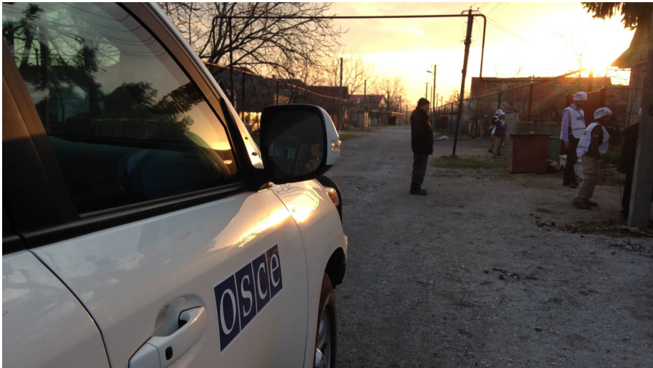
СММ вперше провела нічне спостереження у Широкиному, 17-18 квітня