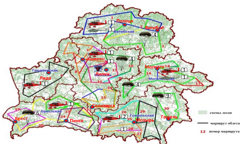
СХЕМА МАРШРУТОВ АВИАПАТРУЛИРОВАНИЯ