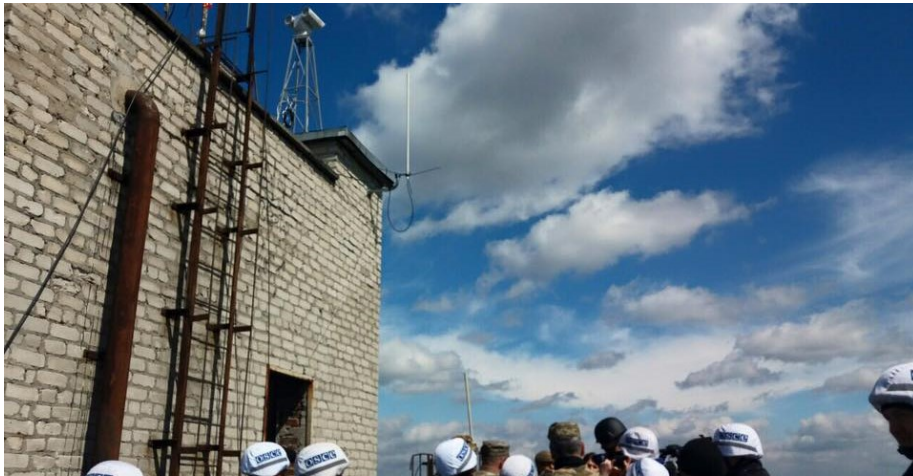
СММ ОБСЕ установила две камеры: одну в Авдеевке и одну на шахте «Октябрьский рудник», апрель 2016 г.