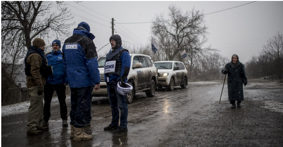
Наблюдатели СММ ОБСЕ во время патрулирования в Луганской области, март 2016 г.