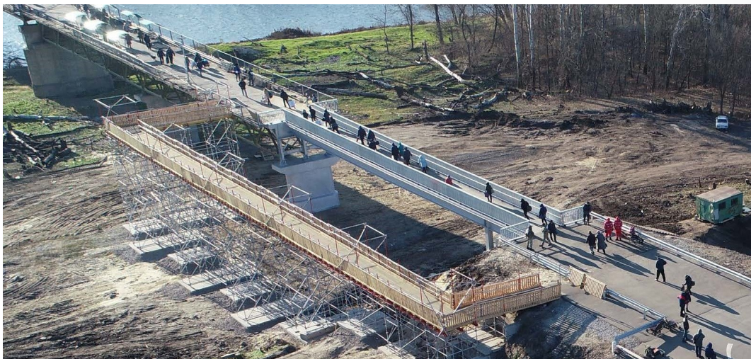
Відремонтована секція мосту біля Станції Луганської (зображення, отримане за допомогою міні-БПЛА СММ)