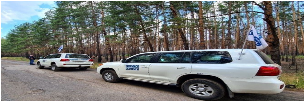
Патруль Місії поблизу Трьохізбенки Луганської області