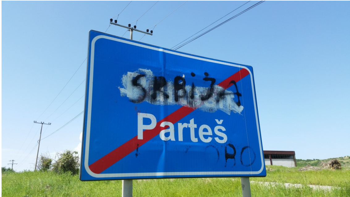
E dromeskoro isharetu ki komuna Partes, 28. maj 2014 – OSCE / Enis Ahmetaj