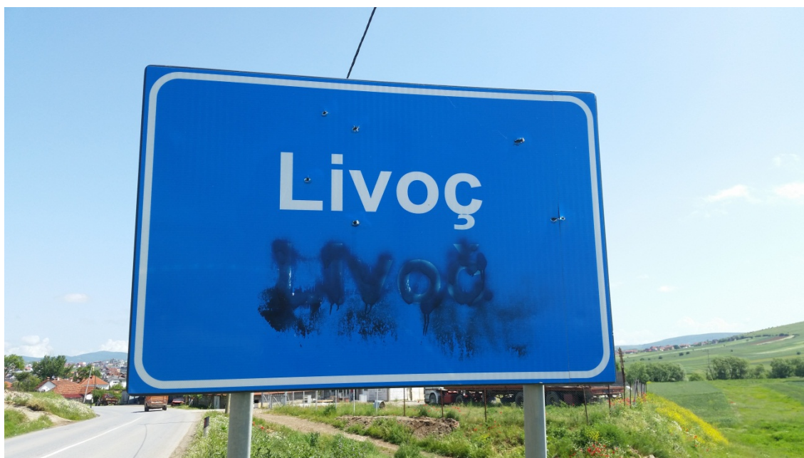
E dromeskoro ishareti ki komuna Gilanakri, 28. maj 2014

O komune aqhona ten a theren shaibe te implementinen pheripea o Krisi vash Qhiyengo Vastipe sar o sebepi kay aqhona telune gendoa e stafesko pe respektipe e interpretaciake/trnslaciake servisengo. Yekh na baro gendo e translatocheng, na adekvatune kualifikacie thay na adekvatune butyake kondicie sherunipea anena ko teluno niveli e translaciako. Komunake translaciake thavda manglape te temelingyon ani sah Kosova e kualifikime stafea thay adekvatune butyake kondicienca. Kosovako Instituti e Publikuna Administraciako manglape te khelel sheruni rola pe zorakeripe e translatocheng thay interpretatocheng janipe andar civilune servisya.