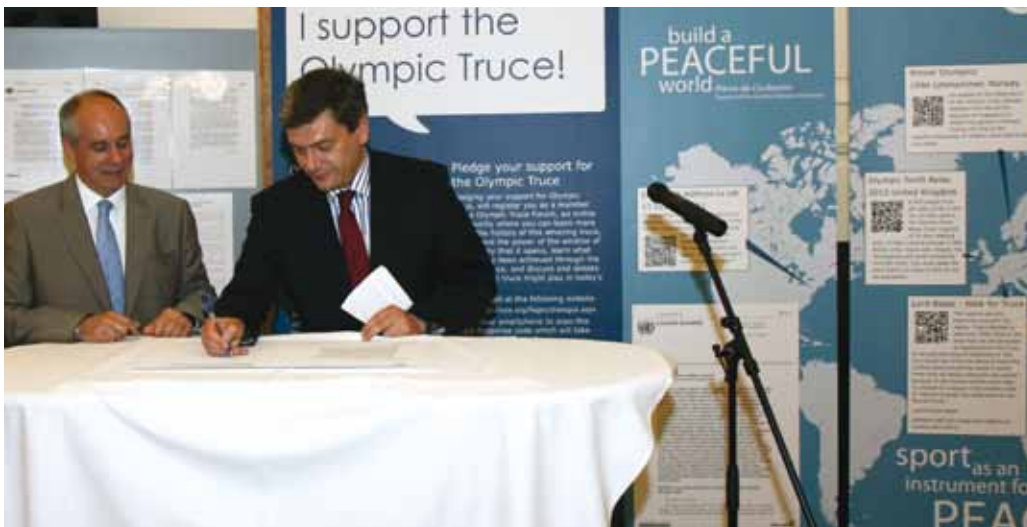
Geoff Cole, Chef adjoint de la délégation du Royaume-Uni et Andreï Roudenko, Représentant permanent de la Fédération de Russie, réaffirment leur soutien à la résolution de l'Assemblée générale des Nations Unies sur la trêve olympique, lors de la Conférence annuelle d'examen des questions de sécurité tenue à Vienne le 27 juin 2012.