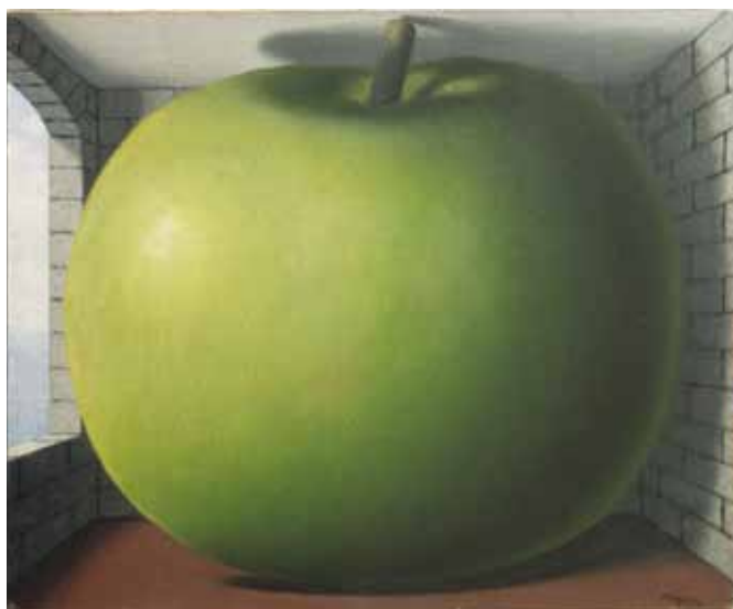
René Magritte, La chambre d'écoute , 1958

L'Ambassadrice Geneviève Renaux était Représentante permanente de la Belgique auprès de l'OSCE de juillet 2008 à juillet 2012. Elle est actuellement à la tête de la Direction Nations Unies au Ministère belge des affaires étrangères.