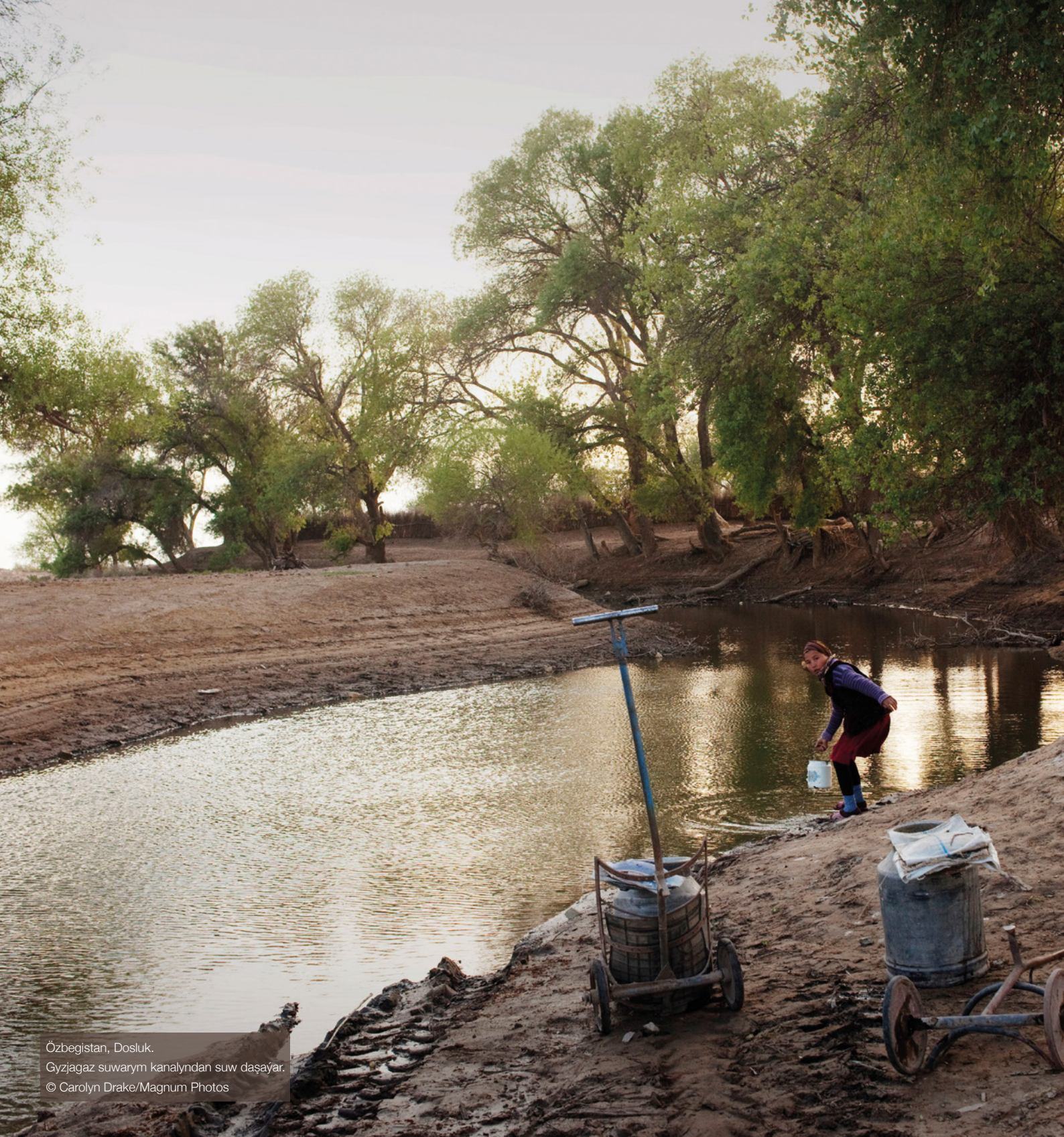
Özbekistan, Dosluk. Gyzjagaz suwarym kanalyndan suw daşayar.