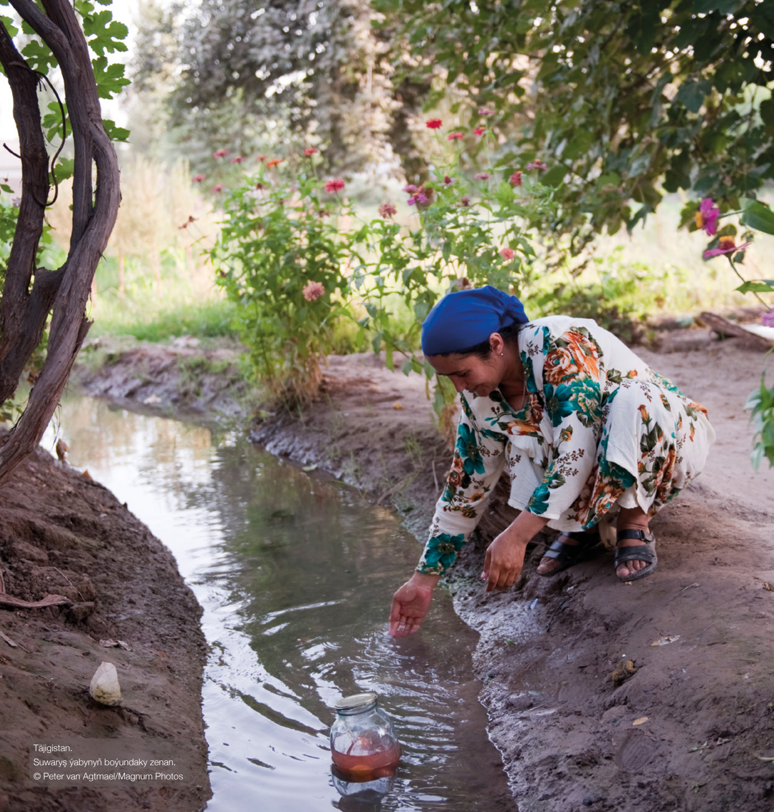
Täjigistan. Suwaryş ýabynyň boýundaky zenan.