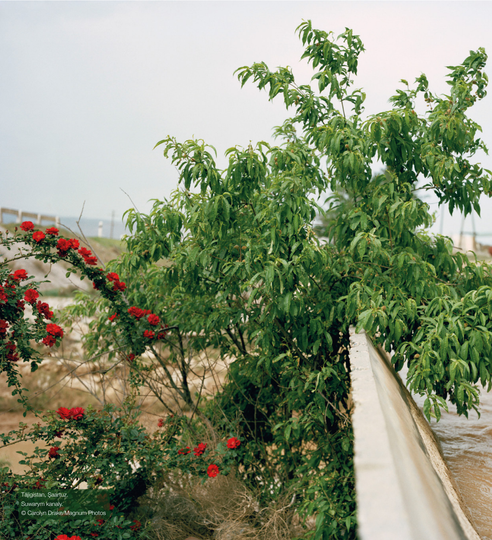
Täjigistan, Saartuz. Suwarym kanaly.