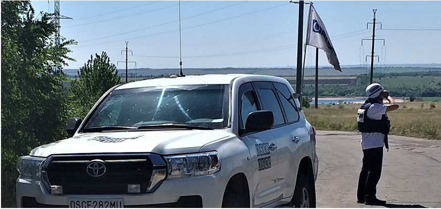
Спостерігач СММ біля Залізного, Донецька область