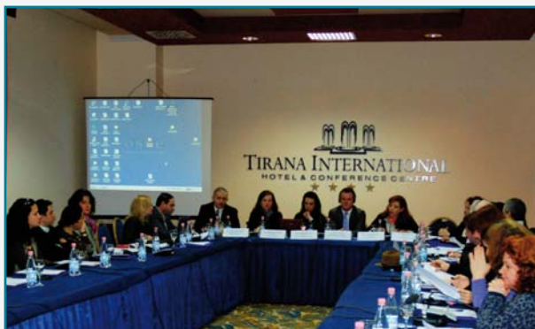
Tryeza e rrumbullakët mbi zhvillimin e një programi Master në Administrimin e Institucioneve Sociale në Sistemin e Drejtësisë, 7 shkurt 2011.

Më 31 janar 2011, në bashkëpunim me Drejtorinë e Përgjithshme të Shërbimit të Provës dhe në kuadrin e projektit të saj për “Praktikat e Efektshme të Shërbimit të Provës në Shqipëri - Faza II”, Prezenca e