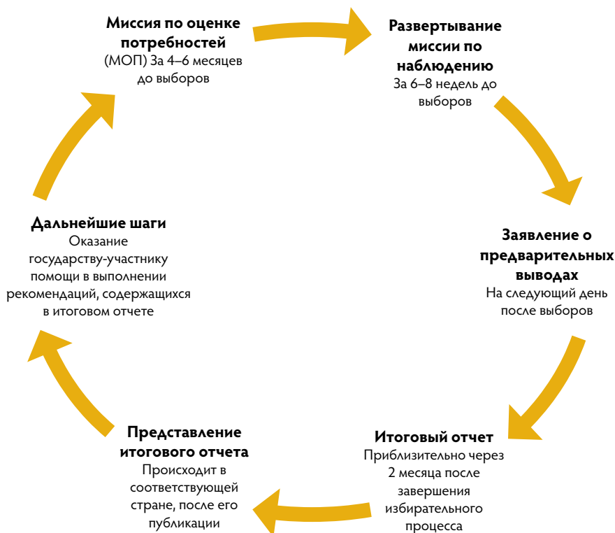
Рис. 1. Цикл наблюдения за выборами

полной мере и со всей серьезностью принимаются во внимание и эффективно выполняются. Эффективные дальнейшие шаги по итогам наблюдения за выборами могут увеличить воздействие деятельности по наблюдению за выборами и ее пользу. Они являются неотъемлемой частью избирательного цикла и должны начинаться сразу после публикации итогового отчета с рекомендациями.