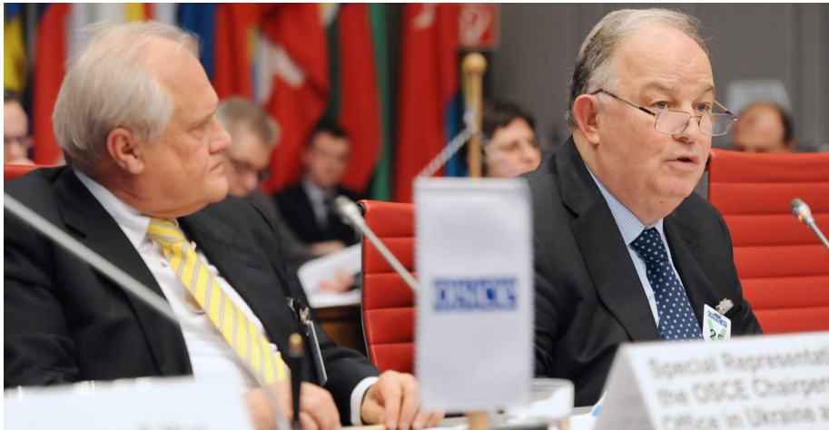
Глава Специальной мониторинговой миссии ОБСЕ в Украине Эртурул Апанкан выступает на заседании Постоянного Совета ОБСЕ, Вена, 28 января 2016 года.