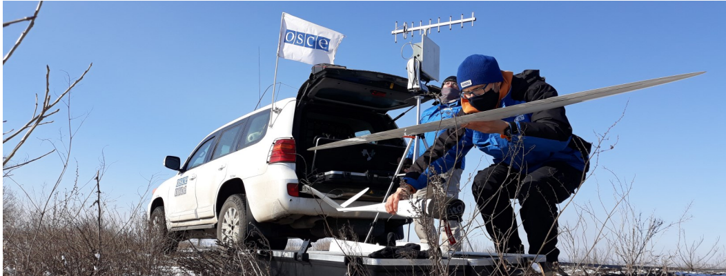
Спостерігачі СММ готуються до запуску БПЛА поблизу Гнутового Донецької області