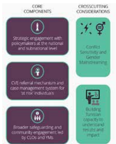
Figura 1: Modeli Jendouba

Ky program për ndërtimin e besimit komunitet-polici për t'iu kundërvënë ekstremizmit të dhunshëm filloi si projekt pilot në Jandouba dhe Tabarka, me qëllim krijimin dhe promovimin e një modeli në kontekstin tunizian për policimin në komunitet dhe për angazhimin kundër ekstremizmit të dhunshëm, bazuar në praktikatat e mira holandeze dhe praktikatat ndërkombëtare. 18 muajt e parë të programit iu kushtuan krijimit të një modeli të zbatueshëm, udhëhequr nga policia në bashkëpunim të ngushtë me qeverinë vendore dhe me burime të tjera me bazë komunitetin.