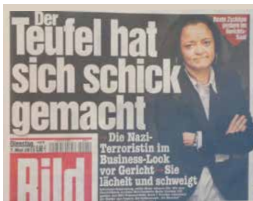
“Djali i pispillosur.” Tabloidi kryesor gjerman Bild raporton mbi gjyqin e NSU-së më 7 maj 2013, me Beate Zschäpe në kryeartikull.

Më vonë, kur Zschäpe u vetëdorëzua, policia (dhe sidomos media) në vend që të analizonte prirjen e grave në organizatat e dhunshme të krahut të djathtë apo vetë biografinë e Zschäpe-s, shpenzoi shumë kohë me hamendësime se ajo kishte marrëdhënie seksuale me dy pjesëtarët e tjerë të celulës dhe se kishte luajtur rol pasiv dhe të papërfillshëm në krimet e dhunshme të kësaj tresheje. Kjo vërteton se si matet pesha e grave në grupet e dhunshme ekstremiste, duke i vendosur ato në kontestin e marrëdhënieve seksuale me burrat, gjë që rezulton në boshllëqe gjatë hetimit të ekstremizmit të dhunshëm.