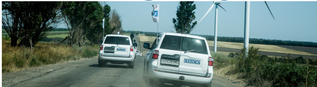
Патруль Миссии в Донецкой области