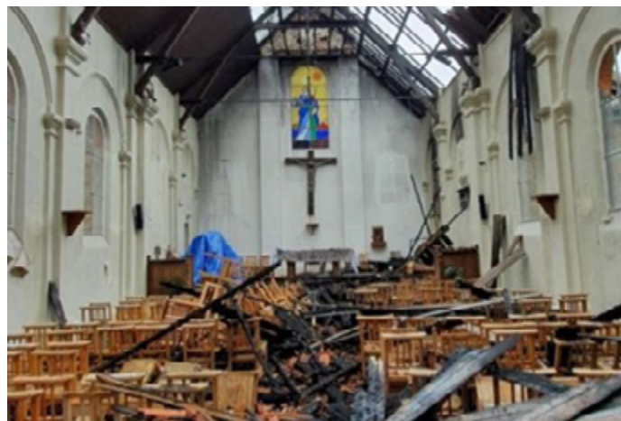
Posljedice podmetnutog požara u crkvi u Francuskoj, 4. juli 2020. (OIDAC)