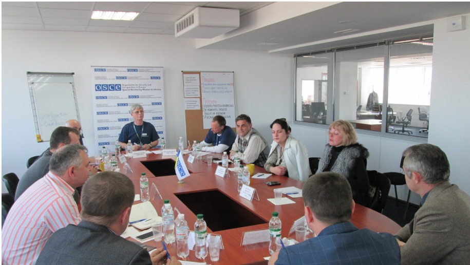
СММ сприяла проведенню круглого столу з активістами в Одесі, 24 квітня.