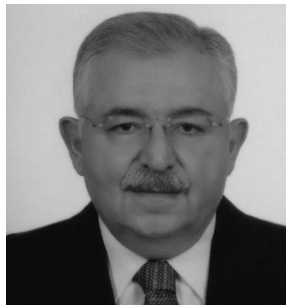
Тахсин Бурджуоглу (Турция)

Посол Ишингер в настоящее время является председателем Мюнхенской конференции по безопасности. До этого назначения, он работал послом Германии в Великобритании (2006-2008) и в Соединенных Штатах (2001-2006), а также заместителем министра иностранных дел Германии (1998-2001). В 2007 году он представлял Европейский союз в Тройке на переговорах о будущем Косово. В 2014 году он выполнял функции Специального представителя действующего Председателя ОБСЕ, оказывая содействие национальному диалогу во время кризиса в Украине. Он является членом как Трехсторонней комиссии, так и Европейского совета по международным отношениям, а также входит в совет директоров многих некоммерческих организаций, в том числе СИПРИ.