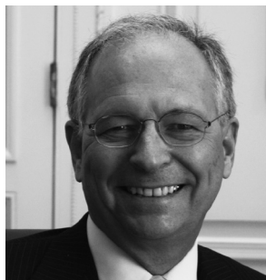
Вольфганг Ишингер (Германия)

Дора Бакоянни является членом парламента Греции. Она занимала пост министра иностранных дел (2006-2009) и действующего Председателя ОБСЕ в 2009 году. Ранее, она избиралась первой женщиной - мэром Афин (2003-2006), назначалась министром культуры (1992) и заместителем статс-секретаря (1990). В 2009 году Дора Бакоянни была выбрана первой женщиной – иностранным член-корреспондентом Академии гуманитарных и политических наук Франции и почетным сенатором Европейской академии наук и искусств. До начала политической карьеры, она работала в департаменте по делам Европейского экономического сообщества Министерства экономической координации.