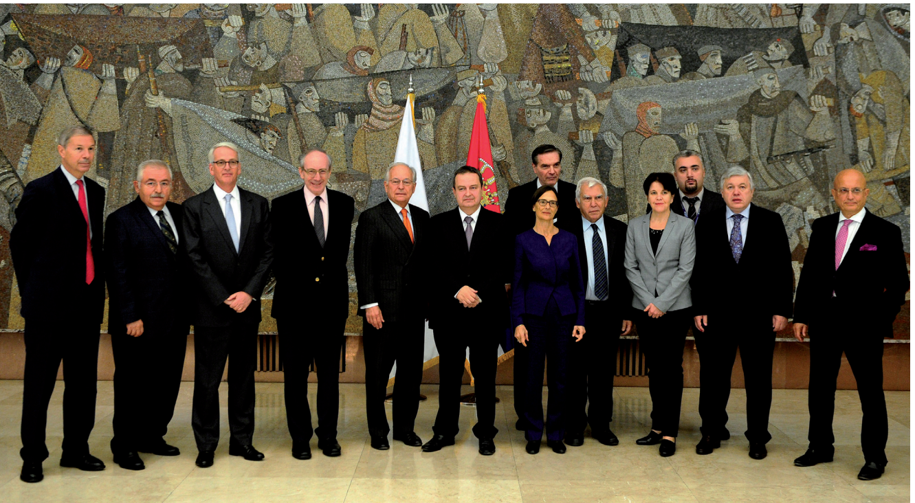
Действующий председатель ОБСЕ, Первый заместитель премьер-министра и министр иностранных дел Сербии г-н Ивица Дачич с членами Группы видных деятелей по европейской безопасности как общему проекту. Белград, 2 октября 2015 г.