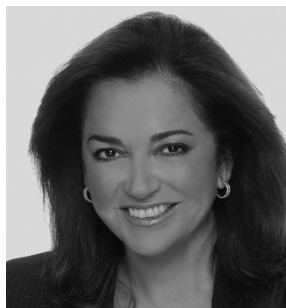
Дора Бакоянни (Греция)

Дора Бакоянни является членом парламента Греции. Она занимала пост министра иностранных дел (2006-2009) и действующего Председателя ОБСЕ в 2009 году. Ранее, она избиралась первой женщиной - мэром Афин (2003-2006), назначалась министром культуры (1992) и заместителем статс-секретаря (1990). В 2009 году Дора Бакоянни была выбрана первой женщиной – иностранным член-корреспондентом Академии гуманитарных и политических наук Франции и почетным сенатором Европейской академии наук и искусств. До начала политической карьеры, она работала в департаменте по делам Европейского экономического сообщества Министерства экономической координации.