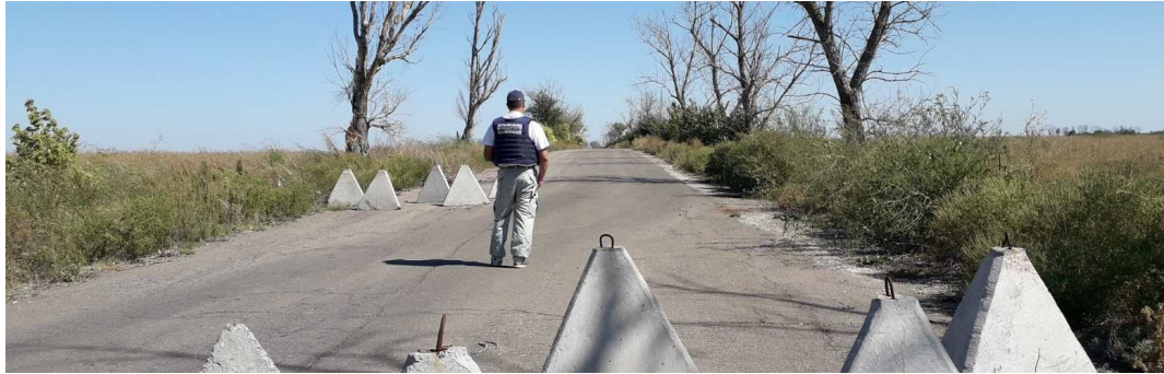
Спостерігач поблизу Лебединського Донецької області