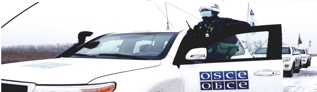
Патруль СММ на дороге возле Богдановки, в пределах участка разведения в районе Петровского, Донецкая область

Специальная мониторинговая миссия ОБСЕ в Украине (СММ) osce.org/ru/ukraine-smm