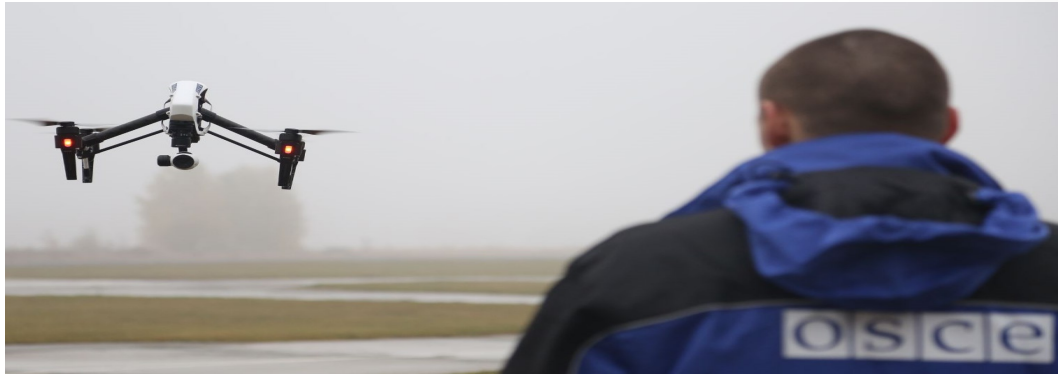
Спостерігач СММ керує польотом БПЛА