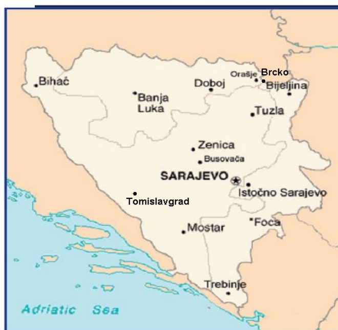
Slika 10: Pregled rasporeda zatvora u BiH