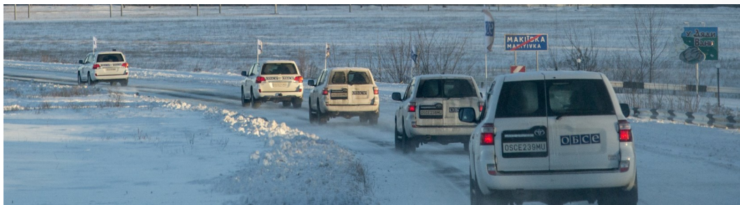
Патруль СММ поблизу Богданівки, Донецька область