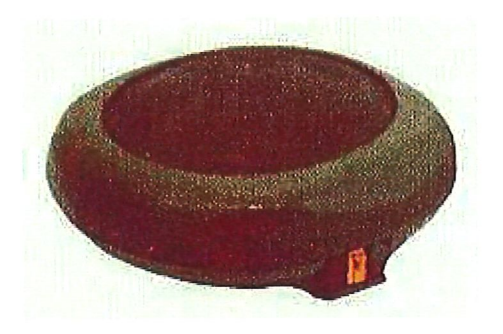
Mina antipersonal modelo P-5