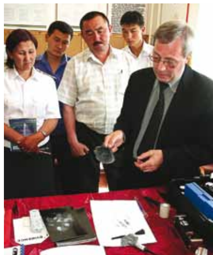
Обучение сотрудников полиции в Бишкеке. Служба внутреннего надзора в период 2009–2010 годов провела оценку деятельности ОБСЕ по подготовке полицейских кадров в Кыргызстане, а также в Сербии и бывшей югославской Республике Македонии