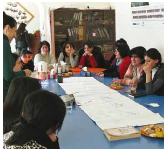
Группа по оценке Службы внутреннего надзора в процессе документирования качественного вклада ОБСЕ в улучшение жизни членов центра консультирования по вопросам женщин в Армении, действующего при поддержке Бюро ОБСЕ в Ереване, ноябрь 2011 года