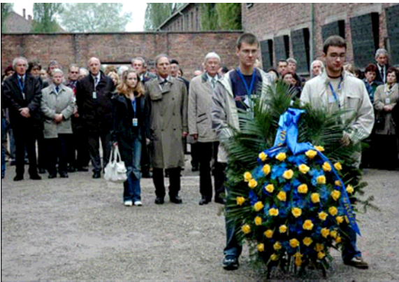
Depositando una ofrenda floral en el Valle de la Muerte en el patio del Bloque 11 en el 1-Stammlager de Auschwitz. Delegaciones de jóvenes y los Ministros de Educación de los 48 Estados Socios de la Convención Cultural Europea, participantes del seminario internacional “Enseñando a recordar a través de la herencia Cultural”, Cracovia y Auschwitz- Birkenau, Polonia, 4-6 de mayo de 2005.

En octubre del año 2002, los Ministros de Educación de los estados miembros del Consejo de Europa dieron curso a la resolución de que se instituyera un “Día de Recordación” en todas las escuelas de sus respectivos países para conmemorar el Holocausto. 1 Además, durante la reunión del plenario de su sexta asamblea general en noviembre de 2005, las Naciones Unidas decidieron hacer del 27 de Enero el día internacional de conmemoración para honrar a las víctimas del Holocausto, y urgieron a los estados miembros a desarrollar programas educativos para transmitir la memoria de esta tragedia a las futuras generaciones. 2