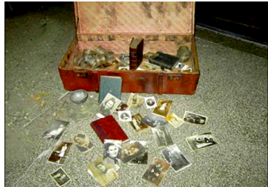
Auschwitz, Polonia, posguerra. Maletas en el Museo. Esta maleta, parte del proyecto del Día de Recordación del Holocausto de Yad Vashem, fue creada por estudiantes del Club del Recuerdo, Colegio Nacional Vlaicu Voda, Rumania, octubre de 2004.