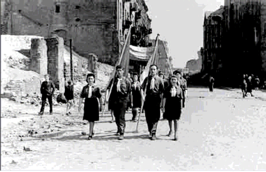
Varsovia, Polonia, posguerra, Marcha de Recordación de las víctimas del Holocausto.

En octubre del año 2002, los Ministros de Educación de los estados miembros del Consejo de Europa dieron curso a la resolución de que se instituyera un “Día de Recordación” en todas las escuelas de sus respectivos países para conmemorar el Holocausto. 1 Además, durante la reunión del plenario de su sexta asamblea general en noviembre de 2005, las Naciones Unidas decidieron hacer del 27 de Enero el día internacional de conmemoración para honrar a las víctimas del Holocausto, y urgieron a los estados miembros a desarrollar programas educativos para transmitir la memoria de esta tragedia a las futuras generaciones. 2