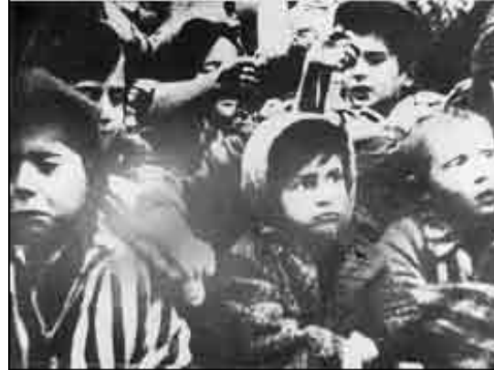
Un ex interno cerca de las barracas del campo. Niños en el campo, alzando sus manos a la vez en Bergen – Belsen, Alemania (Yad Vashem) Liberación, Auschwitz, Polonia (Yad Vashem)