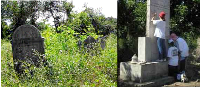
Estudiantes limpiando un cementerio judío abandonado en Szob, Hungría, 2002 (Escuela de la Comunidad Judía Lauder Javne, Budapest)