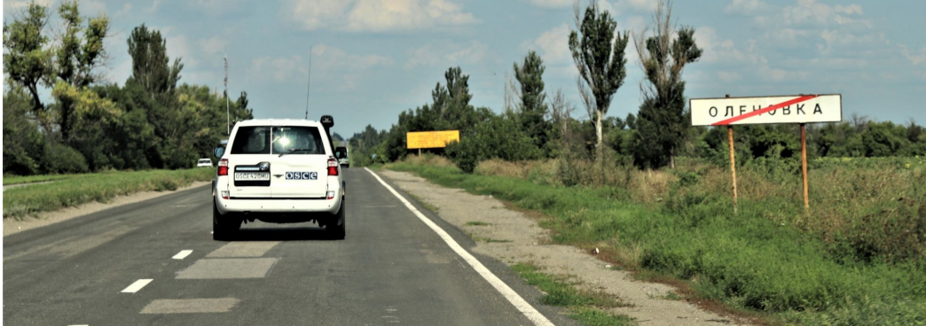
Партуль місії біля Оленівки в Донецькій області