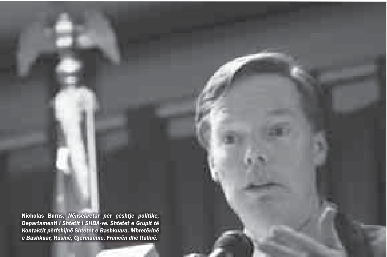
Nicholas Burns, Nënsekretar për çështje politike, Departamenti i Shtetit i SHBA-ve. Shtetet e Grupit të Kontaktit përfshijnë Shtetet e Bashkuara, Mbretërinë e Bashkuar, Rusinë, Gjermaninë, Francën dhe Italinë.

Kontakt Grupi e ka shqyrtuar letrën e Sekretarit të Përgjithshëm të KB-ve dhe raportin e Kai Eides për vlerësimin gjithëpërfshirës të situatës në Kosovë, i cili është përfshirë në këtë letër, që i janë dorëzuar Këshillit të Sigurimit të KB-ve me 7 tetor 2005.