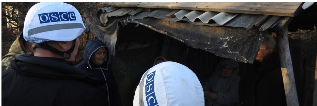
Наблюдатели СММ осуществляют патрулирование в Золотом Луганской области