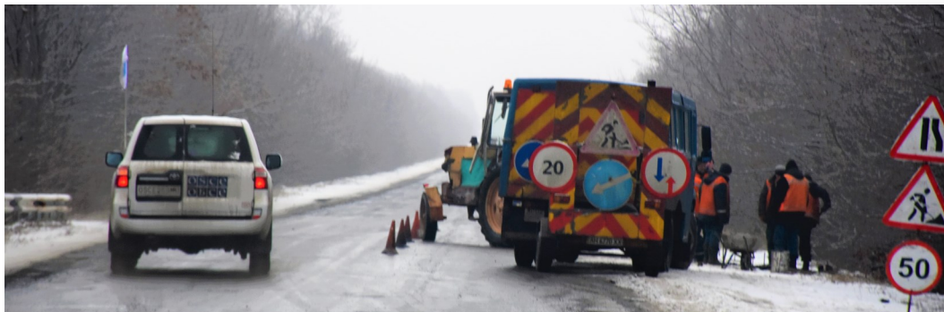
Патруль СММ на дорозі в Донецькій області