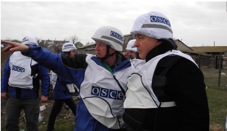
Голова СММ, Посол Апакан, відвідав Маріуполь з 18 по 19 березня 2015 року.