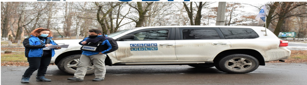
Патруль СММ у Верхньоторецькому Донецької області (СММ ОБСЄ)