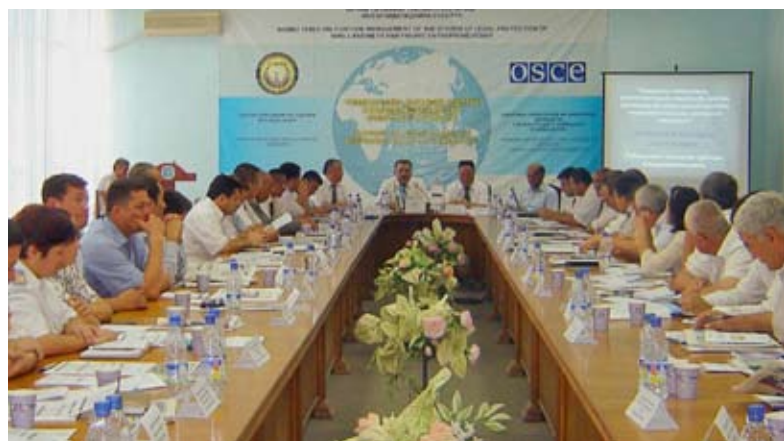
Обучение арбитражных судей в Узбекистане

В Узбекистане все большее число предпринимателей обращается в арбитражные суды для решения экономических и коммерческих конфликтов. Это прямое следствие принятия закона о таких судах в 2007 г. Правительство, бизнес и международные организации приветствовали создание третейских судов в стране, в особенности в связи с тем, что они рассматривают дела более эффективно и гибко при меньших финансовых издержках по сравнению с обычными судебными слушаниями. Признавая, однако, потребность в дополнительных программах по наращиванию потенциала и повышению осведомленности, Координатор проектов ОБСЕ в Узбекистане стал в 2010 г. сотрудничать с узбекской Ассоциацией арбитражных судов и запустил серию семинаров по подготовке третейских судей из всех регионов страны. Осуществление этого проекта продолжается и в 2011 г. Он также включает поставку местным судам компьютерного оборудования.