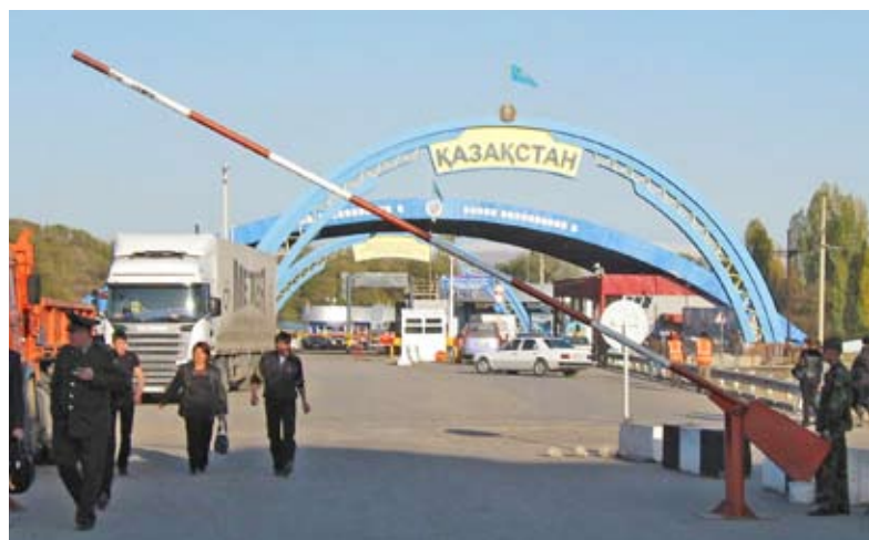
Пункт пересечения границы между Казахстаном и Кыргызстаном

На политическом уровне Бюро ОБСЕ также сотрудничает с таджикскими властями с целью продвинуть концепцию государственно-частного партнерства и разъяснения, как такие партнерства могут помочь модернизировать пункты пересечения границы. В декабре прошлого года ОБСЕ и Федерация турецких торгово-промышленных палат организовали ознакомительную поездку для должностных лиц высокого уровня из Таджикистана на контрольно-пропускной пункт на турецко-болгарской границе, чтобы продемонстрировать эту концепцию в действии.