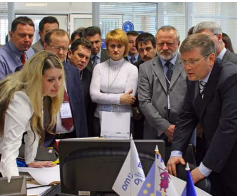
Участники конференции по «электронному правительству», организованной Координатором проектов ОБСЕ в Украине, апрель 2011 г.

группа, которой ставилась задача получения эмпирических данных, чтобы помочь прояснить различные варианты принятия решений и определить, каким образом эта концепция может наиболее полезным образом быть реализована в Узбекистане. Координатор проектов ОБСЕ оказывал поддержку этому процессу путем организации - в числе других инициатив - ознакомительной поездки для узбекских экспертов, во время которой они узнали, как проводить высококачественные оценки воздействия и получили информацию о передовой практике в области сбора данных. В феврале 2011 г. состоялась конференция, рассмотревшая такие вопросы, как консультации заинтересованных сторон, стилистика подготавливаемых документов и распространение информации в электронном виде.