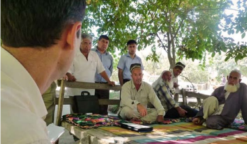
Эксперт ОБСЕ консультирует сельский кооператив в Хатлонской области Таджикистана

Проект в Узбекистане, осуществляемый при поддержке Координатора проектов ОБСЕ, направлен на совершенствование законодательной базы для малого бизнеса. Парламентский комитет, занимающийся вопросами промышленности, строительства и торговли; местная НПО и Центр исследований правовых проблем находятся в процессе подготовки двух новых законопроектов, которые, как ожидается, внесут изменения в климат для торговли и бизнеса в стране. Офис Координатора проектов ОБСЕ в Узбекистане помогает этой инициативе, предоставляя необходимые международные экспертные знания и содействуя обмену примерами наилучшей практики. В прошлом году офис Координатора проектов также организовал серию круглых столов и конференций, чтобы предоставить возможность всем заинтересованным сторонам осмысленно способствовать процессу подготовки законопроектов.