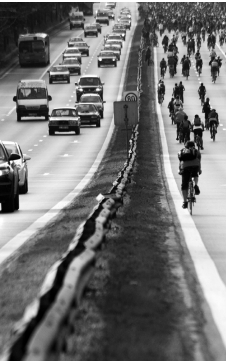
Фотография-победитель фотоконкурса ОБСЕ 2011 г., иллюстрирующая ключевую тему во втором измерении ОБСЕ этого года: устойчивый транспорт