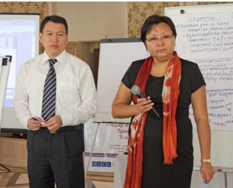
Обучающий семинар ОБСЕ по гендеру и трудовой миграции в Астане, Казахстан, в сентябре 2010 г.

прибыли из России, Закавказья, Центральной Азии, Восточной Европы, Юго-Восточной Европы и Европейского Союза.