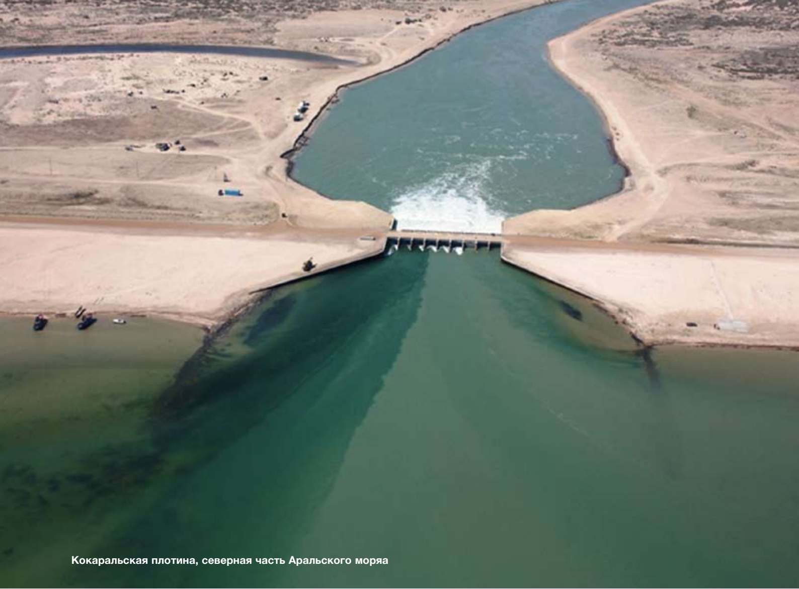
Кокаральская плотина, северная часть Аральского моря

Поскольку данная проблема явно затрагивает все страны, примыкающие к Аральскому морю, Центр ОБСЕ поддерживает обмен передовым опытом по управлению водными ресурсами в контексте сотрудничества Казахстана с другими странами. Например, он оказывает содействие, вместе с ЕЭК ООН, казахстанско-киргизской Комиссии по управлению трансграничными водными ресурсами рек Чу и Талас. В мае 2011 г. МФСА и Центр ОБСЕ также приступили к реализации проекта по решению проблем сохранения биоразнообразия в водно-болотных угодьях северной части Аральского моря.