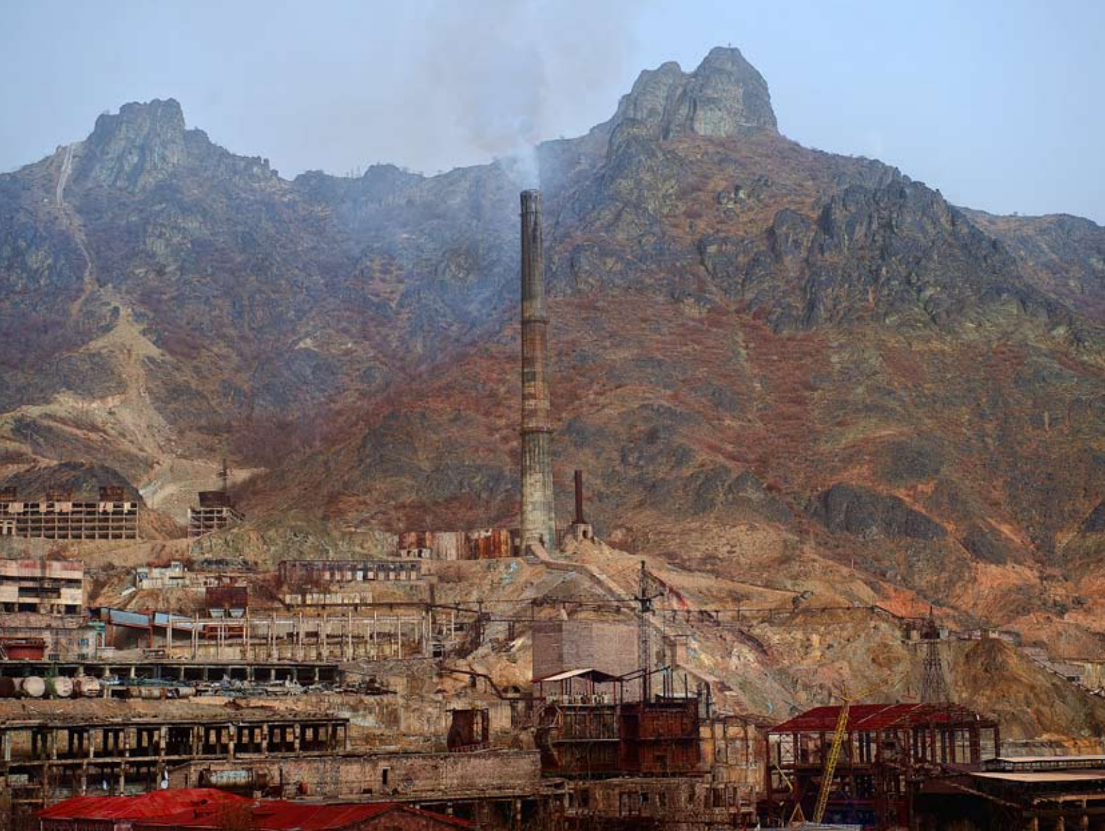
г. Алаверди, коммерческий и промышленный центр в Армении

В Юго-Восточной Европе Бюро Координатора поддерживало выполнение положений Орхусской Конвенции в Албании, Боснии и Герцеговине, Черногории и Сербии.