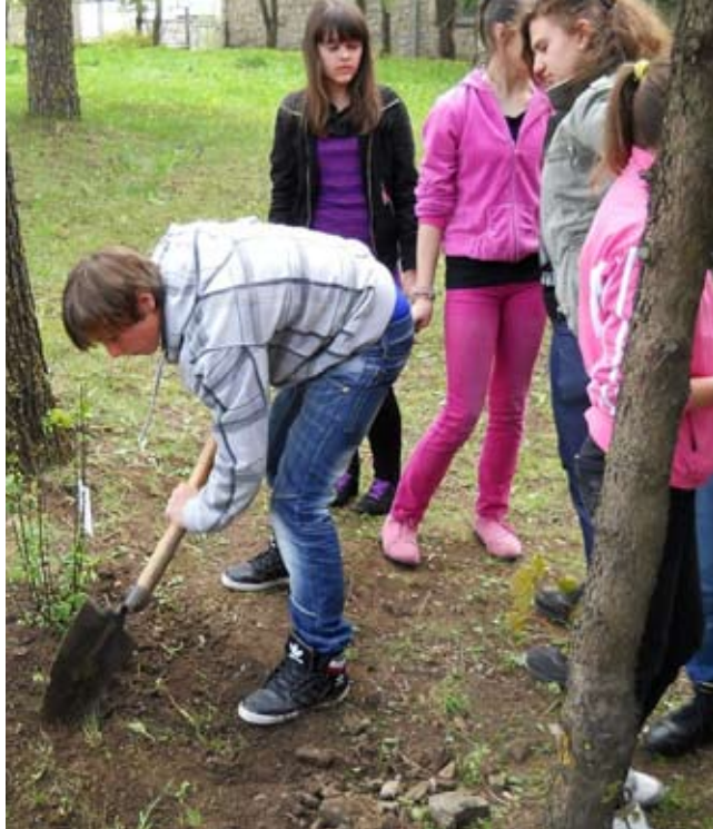
Студенты занимаются посадкой деревьев в рамках празднования Дня Земли 2011 г. в г. Босански Петровац, Босния и Герцеговина