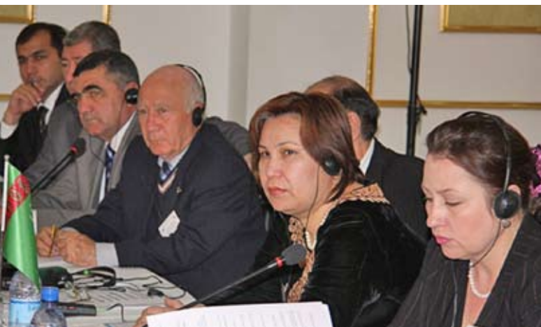
Слушатели семинара по энергетической дипломатии, организованного Центром ОБСЕ в Ашхабаде и БКЭЭД в Туркменистане в марте 2011 г.

В сотрудничестве с национальными экспертами и властями Центр ОБСЕ в Ашхабаде и Бюро Координатора провели в марте семинар по энергетической дипломатии для представителей различных отраслей Туркменистана – нефтегазового, энергетического, экономического и финансового секторов, а также для членов академического сообщества. Четыре международных эксперта обучали 27 сотрудников ведомств Туркменистана по вопросам, связанным с энергетикой, и тому, как способствовать укреплению национального потенциала и повышению возможностей у страны в плане дальнейшего укрепления энергетической безопасности. Участники семинара обсудили такие вопросы, как механизмы ценообразования на нефть и газ, роль торговли фьючерсами и инвестиционных банков, и схемы торговли квотами на выбросы углекислого газа. Затем, в августе, состоялся еще один семинар. На 2012 г. планируются новые учебные мероприятия.