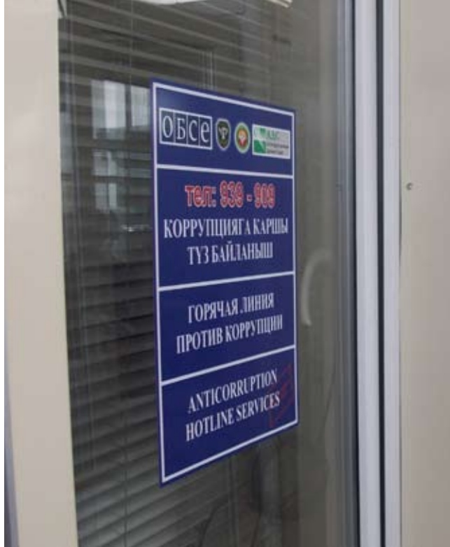
Бюро содействия по анти-коррупционным вопросам в здании таможни г. Акзол, Кыргызстан

ную программу, снабжая кандидатов на должности в системе госзакупок учебным пособием, помогающим им пройти сертификацию. С декабря 2010 г., когда начался процесс сертификации, необходимые экзамены успешно сдали около 530 специалистов.