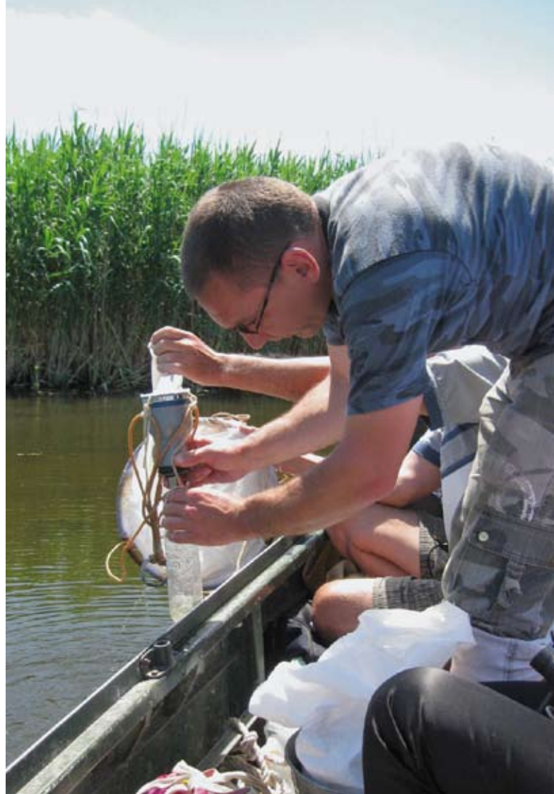
Полевое исследование рыбного разнообразия в нижнем течении Днестра, Маяки, Украина

Важную роль в наращивании объема и улучшении качества имеющихся данных по экологическим вопросам может играть географическая информация. Поэтому Днестр-III дал возможность экспертам по такой технологии разработать экспериментальную геоинформаци-