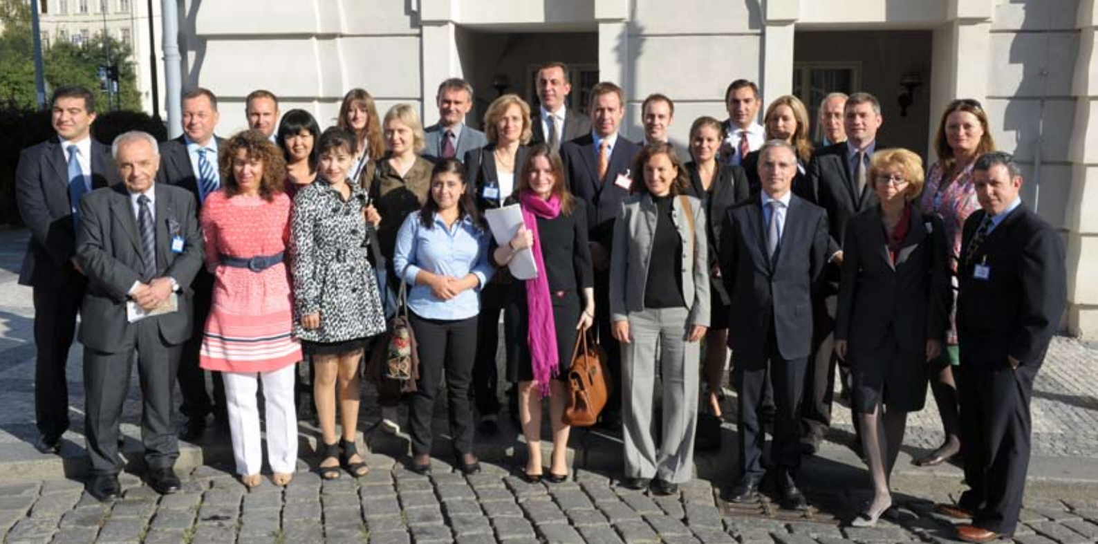
Координатор экономической и экологической деятельности ОБСЕ и сотрудники Бюро Координатора вместе с представителями Литовского председательства в ОБСЕ 2011 г., предстоящего Ирландского председательства в ОБСЕ 2012 г., а также сотрудниками экономического и экологического измерения из полевых присутствий Организации

области устойчивой энергетики в странах-участницах ОБСЕ; а также роль ОБСЕ в распространении практики, направленной на обеспечение устойчивости энергетики.