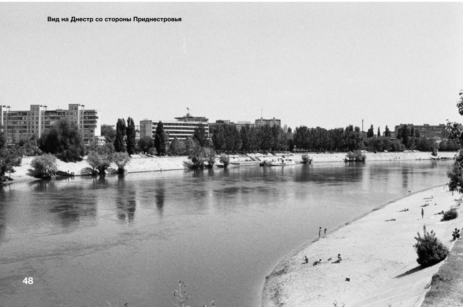
Вид на Днестр со стороны Приднестровья

Миссия реализует эти проекты вместе с общинами, проживающими по обе стороны Днестра, который