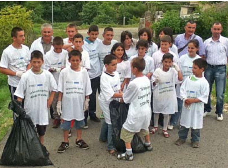
День очистки территории у эко-клуба из долины Вьоса в Албании

В Албании Присутствие ОБСЕ реализовало несколько идей о том, как уменьшить загрязнение пластиковым мусором в долине Вьоса – месте потрясающей красоты со снежными вершинами гор и зелеными пастбищами. Эти идеи включали установку в данном регионе в общей сложности 77 контейнеров для отходов, вместе с ориентированными на защиту экологии дорожными знаками, чтобы повысить осознание людьми проблем от безответственного выбрасывания пластикового мусора. Кроме того, в школах были созданы пять «эко-клубов», местные чиновники и частные фирмы прошли обучение сбору и утилизации отходов, а тренировки по очистке территории способствовали росту движения добровольных защитников природы.