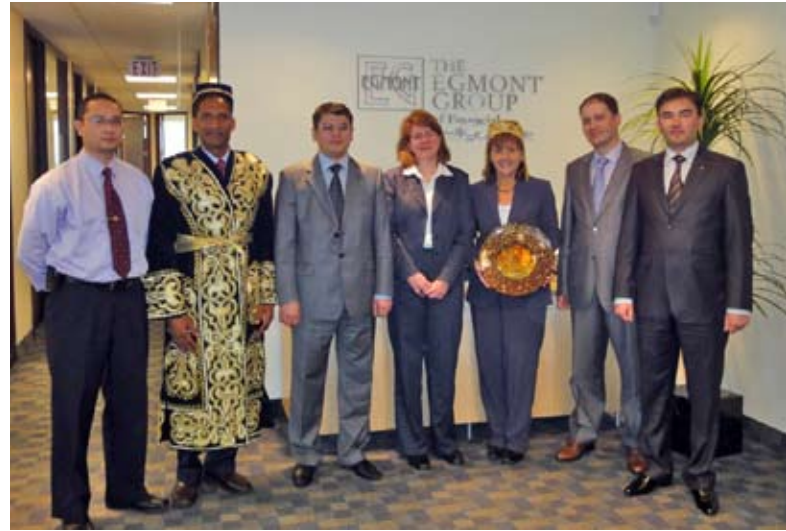
ОБСЕ поддержало Узбекистан в его усилиях по получению членства в Группе «Эгмонт»

стран-участниц ОБСЕ, а также азиатских и средиземноморских стран, являющихся Партнерами ОБСЕ по сотрудничеству. БКЭЭД был подготовлен итоговый доклад, размещенный на сайте ОБСЕ.