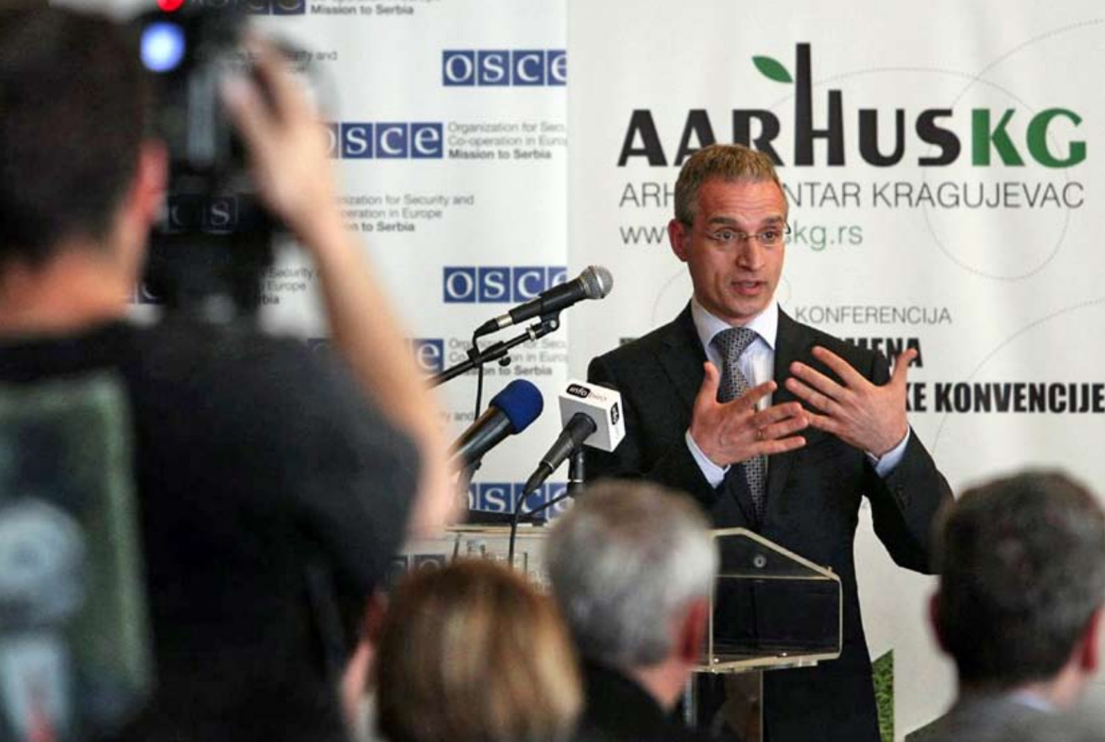
Горан Сви́ланович, Координатор экономической и экологической деятельности ОБСЕ, выступает перед представителями СМИ на конференции по реализации положений Орхусской Конвенции, Сербия, апрель 2010 г.