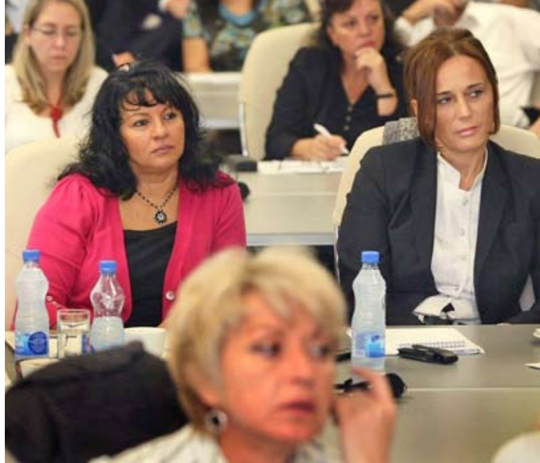
Участники семинара ОБСЕ для финансовых институтов по проблематике противодействия финансированию терроризма, проведенного в Сербии

Работа по борьбе с легализацией доходов от преступной деятельности и противодействие финансированию терроризма настолько тесно взаимосвязаны, что для них широко используют общее сокращение - ПОД/ФТ. Во всем мире этими вопросами занимаются многие агентства, институты и группы, в числе которых - Группа «Эгмонт», международный формат для подразделений финансовой разведки (ПФР). ПФР являются агентствами, ответственными за отслеживание большинства аспектов финансовой информации в стране.