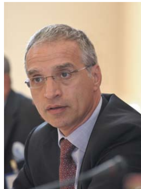
Горан Свиланович, Координатор экономической и экологической деятельности ОБСЕ