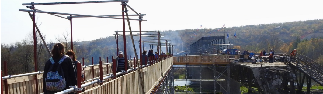
Цивільні особи переходять тимчасовим обхідним пішохідним мостом поблизу Станції Луганської