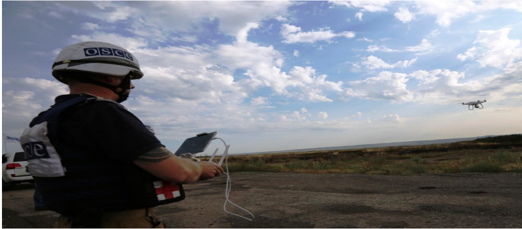
Спостерігач СММ пілотує БПЛА