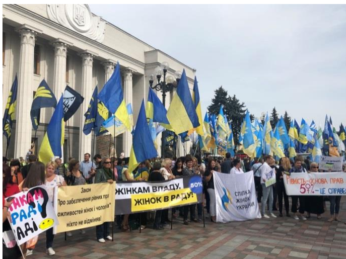
(Митинг, за проведенням якого наблюдала команда СММ перед зданием Верховної Ради України, де жесниці виступали с требованием о включении 50-процентной гендерной квоты в законы Украины о выборах, 6 сентября 2018 г.)

В то время как некоторые респонденты выразили обеспокоенность тем, что достижения женщин в политической деятельности на местном уровне до сих пор остаются незамеченными, а также отметили недостаточность внедрения политики гендерного равенства для решения более системных проблем, например коррупции, собеседники СММ в различных регионах обычно поддерживали тенденцию к увеличению участия женщин в политической деятельности на местном уровне. Они подчеркнули, что женщинам больше доверяют в их общинах, они предлагают другую точку зрения и их вообще считают организованными, коммуникабельными и преданными идее решения практических вопросов и принесению пользы своим избирателям. В то время как трое выборных должностных лиц высказались пессимистично относительно равноправного участия мужчин и женщин в будущем, большинство из 98 выборных должностных лиц заявили, что они ожидают, что все больше женщин будут брать на себя политическую ответственность.